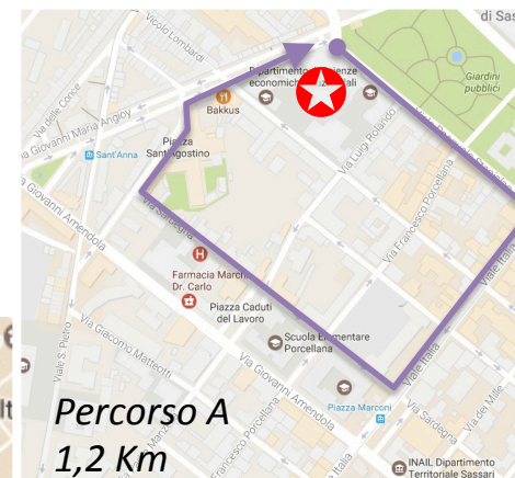
Percorso A 1,2 Km

Corsa non competitiva a cui sono invitati a partecipare tutti i congressisti. Saranno disponibili 2 tracciati (1,2 e 5 Km) per persone con disabilità fisica, motoria o sensoriale, eventualmente accompagnati da personale assistenziale e normodotati.